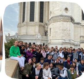
De gauche à droite : sortie au musée Ampère pour les 4e1, 2, 8 et 9. Visite insolite de Fourvière pour les 4e1 et 4e2.

Sur le niveau de Quatrième, plusieurs sorties également en début d'année scolaire : deux classes sont parties en EPI le 13 octobre, pour une visite insolite de Lyon au 19ème siècle, organisée par Mmes D'Aubigny et Monier. L'objectif : découvrir la maison des canuts, le quartier de la Croix Rousse et Fourvière afin de s'en servir comme décor à la nouvelle policière qu'ils devront ensuite écrire en cours de français. Les élèves ont pu voir Lyon depuis les toits de Fourvière... impressionnant !