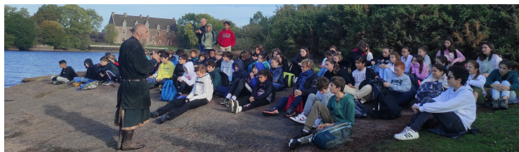
Article et photo Marie Prast

Du 18 au 21 octobre derniers, les classes de 5e1 et 5e4 ont pu se rendre en terre bretonne, sur les traces du Roi Arthur dans le cadre des voyages d'EPI (Enseignements Pratiques Interdisciplinaires). Après avoir visité la Porte des Secrets, scénographie qui invite au voyage dans le merveilleux et présente les lieux phares de la région, les élèves ont participé aux Jeux Légendaires du Centre de L'imaginaire Arthurien au Château de Comper, en compagnie de personnages costumés et hauts en couleurs pour une immersion totale dans le monde merveilleux des Chevaliers de la Table Ronde. Les élèves se sont également baladés dans la forêt de Brocéliande au gré des contes de nos guides conteurs costumés. Le Tombeau de Merlin, le Val Sans Retour de la Fée Morgane, la Fontaine de Barenton du chevalier Yvain, le lac magique de la Fée Viviane n'ont plus de secrets pour ces élèves.