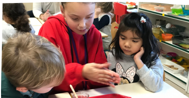
Textes et photos CR Béatrice Thivent, Bénédicte Charmay et Hélène Gammess - enseignantes en maternelle et primaire.